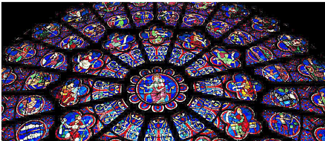
Rosone di Notre-Dame di Parigi

Fraternità della Santissima Vergine Maria - Jesus Sacerdos et Rex