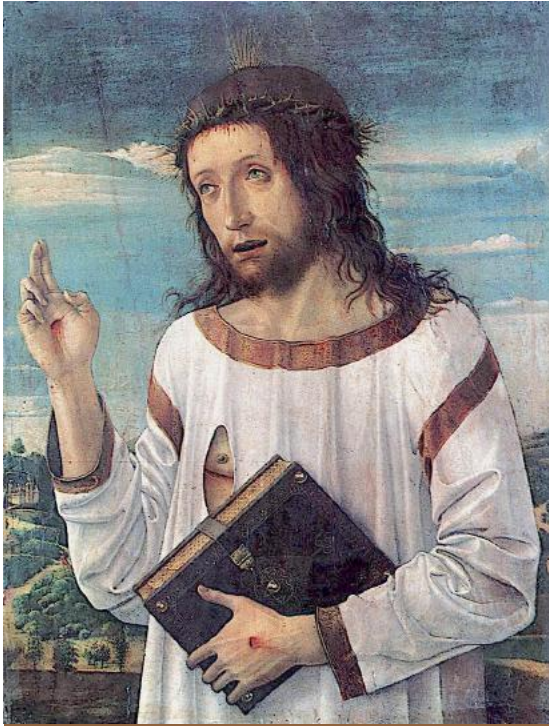
Le "Christ bénissant" de Bellini au Louvre

Pour participer au mystère pascal, il est nécessaire de se consumer comme le cierge pascal, en brûlant. La Résurrection est un mystère qui demande que nous soyons "allumés" que nous ayons en nous une