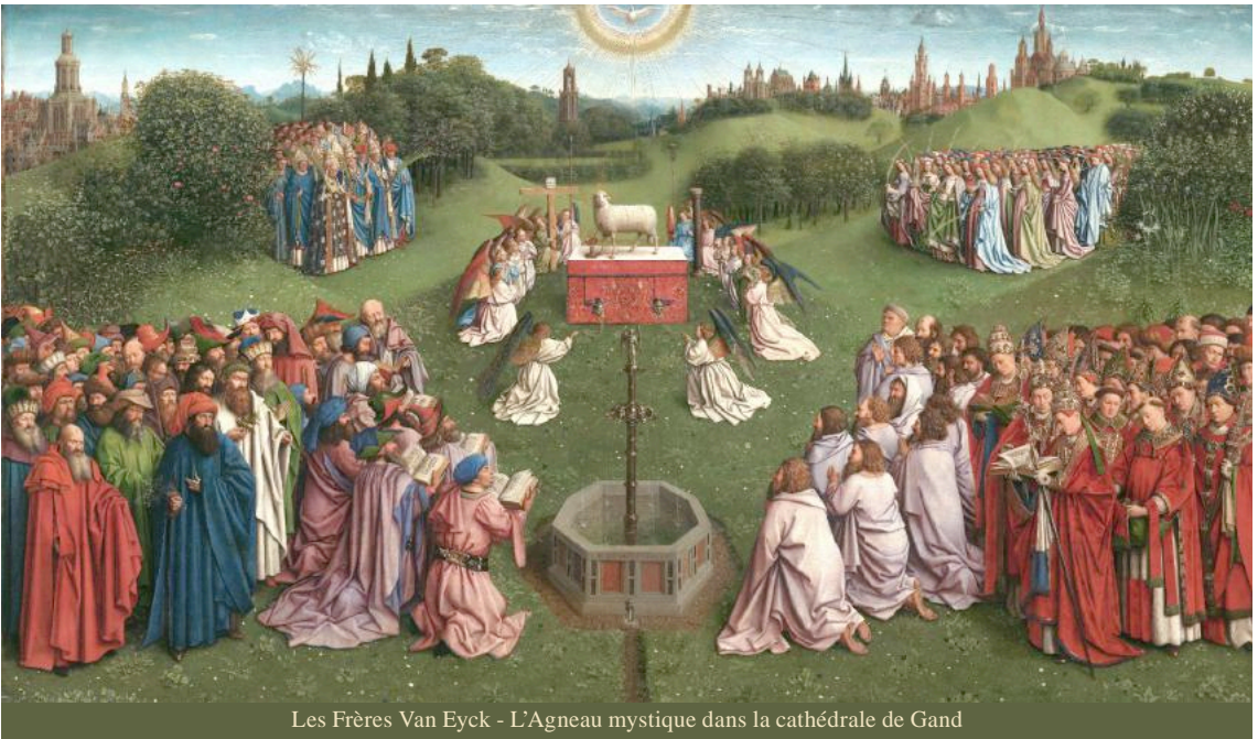
Les Frères Van Eyck - L'Agneau mystique dans la cathédrale de Gand