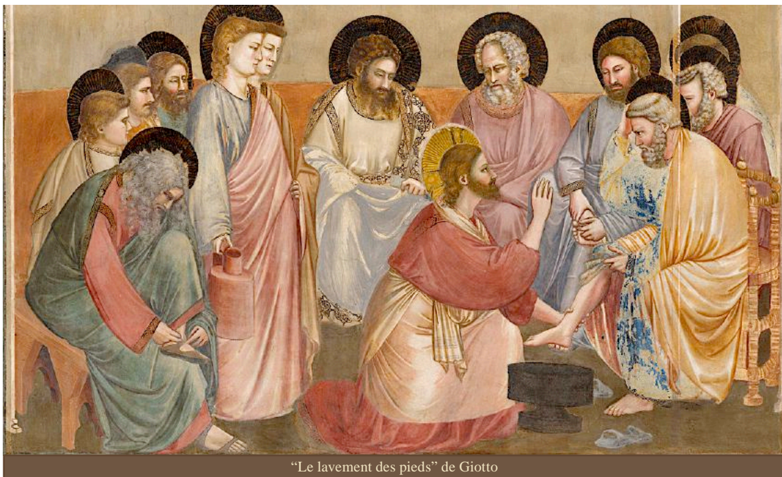
“Le lavement des pieds” de Giotto