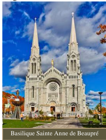
Basilique Sainte Anne de Beaupré

Nous pouvons dire, à la suite des Pères, que l'ardeur de son attente du Messie a purifié le sein d'Anne et lui a obtenu la grâce d'enfanter la Mère du Sauveur ; c'est pourquoi nous la prions particulièrement pour les mamans en difficulté d'enfantement. Prions-la avec les paroles de l'Église :