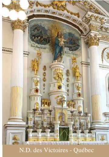
N.D. des Victoires - Québec

nances et les religions ; de plus, parmi les catholiques, il y a des évêques de rites différents. À cela s’ajoute la réalité bilingue qui rend nécessaire en certains endroits de la ville, la présence de deux paroisses sur le même territoire, l’une francophone et l’autre anglophone. Les jeunes se trouvent en présence d’une multiplicité de propositions, et ont parfois du mal à percevoir avec clar-