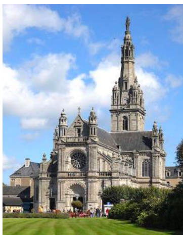
Basilique Sainte Anne d'Auray

La bulle du pape Grégoire XIII instituant canoniquement la fête de sainte Anne dit: "...désirant exciter dans les cœurs chrétiens une dévotion dont l'ancienneté remonte aux premiers siècles de l'Église...".