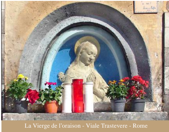
La Vierge de l'oraison - Viale Trastevere - Rome

Les dernières années, il était de plus en plus difficile de communiquer avec Amad-